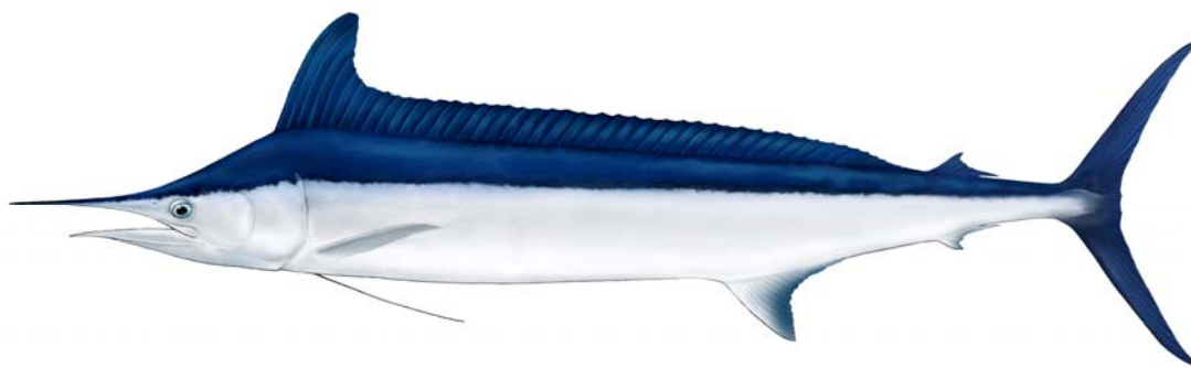
Figura 1. Dibujo de un ejemplar adulto de marlín del Mediterráneo, por Les Gallagher (Les Gallagher: fishpics).